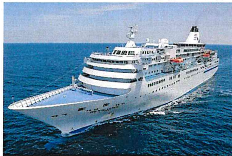
ぱしふいっくびいなす