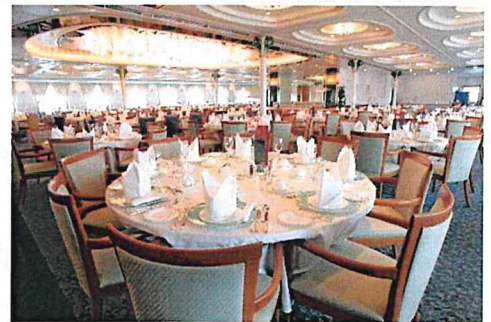
ぱしふいっくびいなす メインダイニング(イメージ)