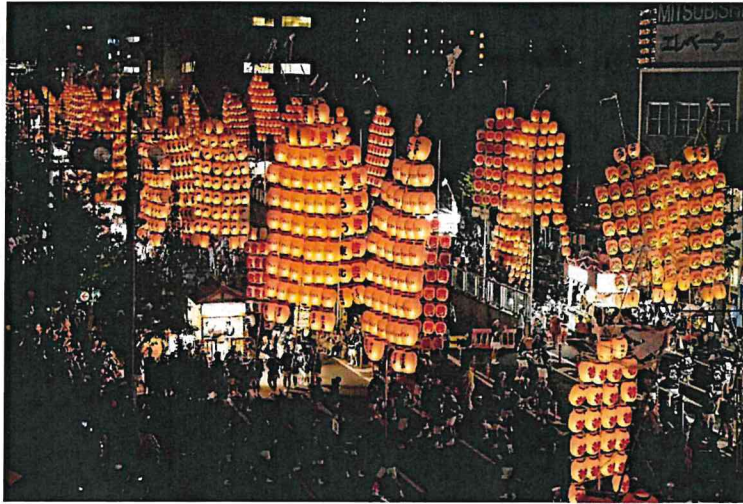
秋田竿燈まつり(イメージ)