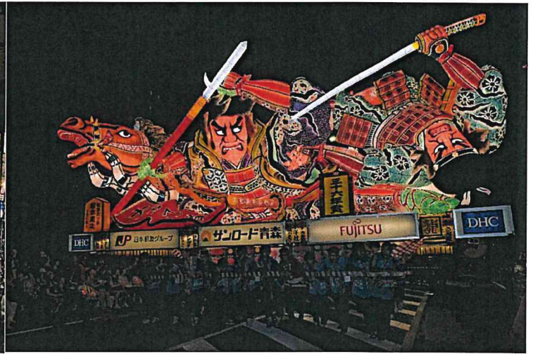
青森ねぶた祭(イメージ)