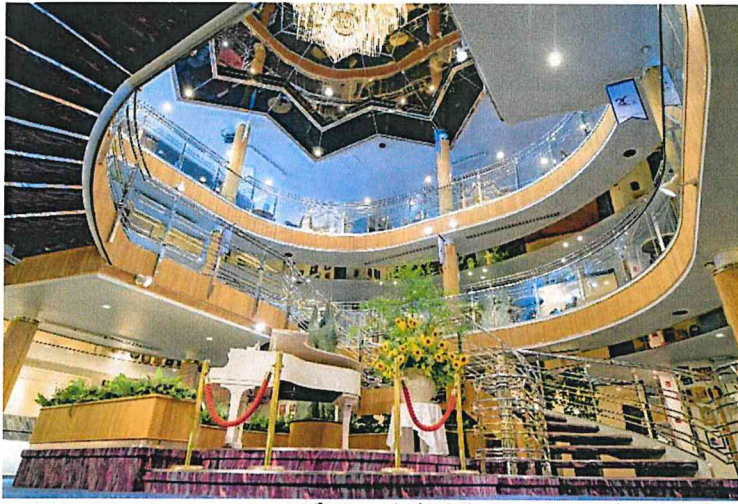
ばしふいっくびいなす エントランスロビー(イメージ)