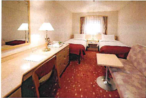
ぱしふいっくびいなす ステートG(イメージ)