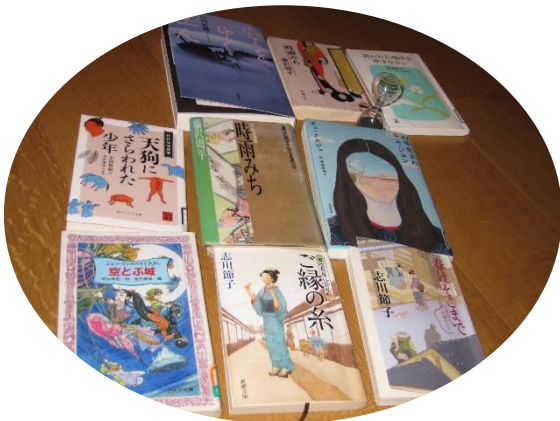
2月に開催された「WiLで読書会!」でおすすめされた本

最近読んだ本や、仕事に役立った本など1冊お持ちください。ジャンルは問いません。読んだ本を人に話して、自分の思いをシェアしたり、深めたりしてみませんか。